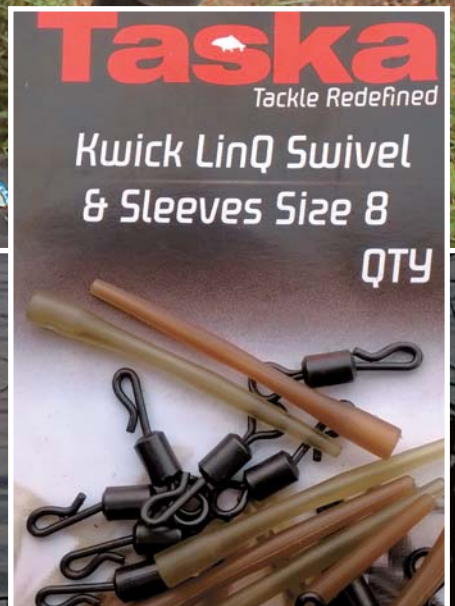
Bár a III. RSD Pontyfogó Carp Cup a behordásos horgászatról szólt, azért fent állt a gubancolódás veszélye, azaz az előkénk főzsinórra történő feltekeredése. Ezt a bosszantó gubancot mi kivédtük a kissé merevebb eltartó csövecskének köszönhetően