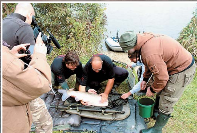
Minden kifogott hal komoly „felhajrással” járt, rengetegen voltak jelen a mérlegelésnél. Hitelesítés, filmezés, fotózás kötelező jelleggel!