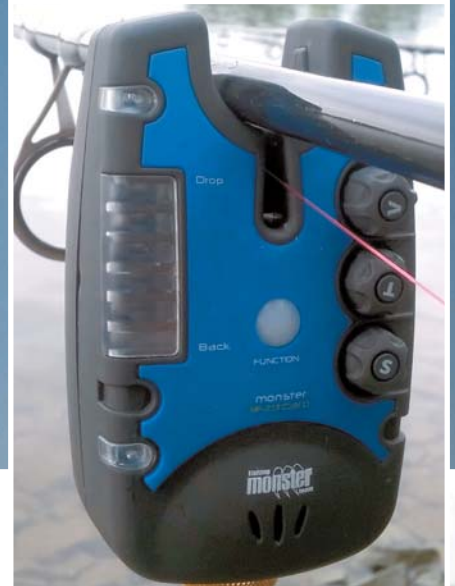
A hosszabb ideig tartó horgászversenyek nélkülözhetetlen felszerelése az elektromos kapásjelző