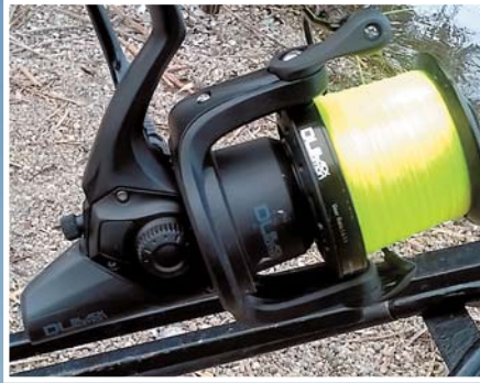
A csónakkal történő biztonságos haladás érdekében ríktó színű, éjjel is jól látható főzsinórt helyezünk fel az orsó dobjára