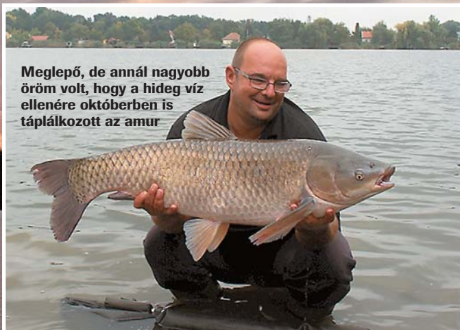
Meglepő, de annál nagyobb öröm volt, hogy a hideg víz ellenére októberben is táplálkozott az amur

A halak minden vízben szeretik a búvóhelyeket, az ilyen jellegű területeket előszeretettel keresik fel, vagy akár tartózkodnak és táplálkoznak ott a nap 24 órájában. Na, ez az RSD-re fokozottan igaz! Nem mondom, hogy nyílt terepen nem lehet fogni – tavasszal nagyon szép halakat fogtam sík kagylópadokon –, de sokkal eredményesebbek lehetünk, ha akadókat, tartásokat horgászunk meg. A versenyen is ilyeneket kellett keresni, és ez elsőre nekünk is csak kevésbé sikerült. Egy napnak el kellett telnie, mire rábukkantunk a lényegre, s megindultak a fogások. Olyan betontörmelékéből, betonvasból felépített tartást fedeztünk fel, mely igazi „halbányának” bizonyult.