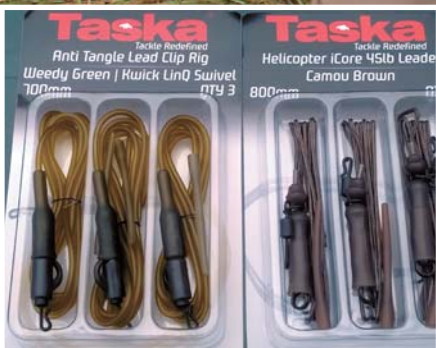
Mivel az RDS-n akadóban is horgászunk, ajánlott olyan végszerelést használni, amiről a kapást követően leoldódik, leakad az ólom